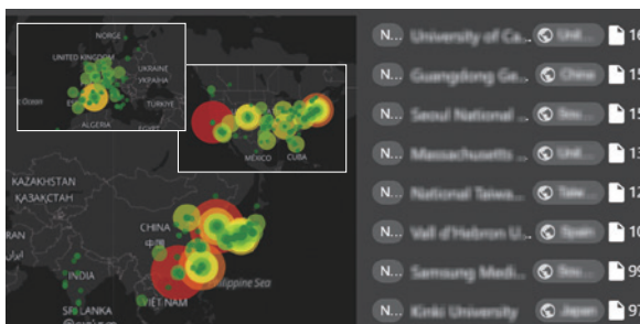
Word Global MAP

論文情報のボリューム(論文数)と発信源(発信エリア・発信施設)を網羅的に分析。国内外の製品関連情報の分布を一目で把握できる。競合品との比較も可能。